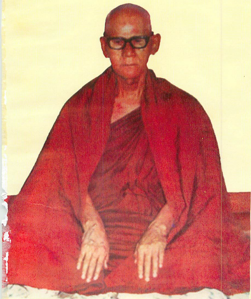
ဆဋ္ဌသင်္ဂီတိပုစ္ဆက အဂ္ဂမဟာပဏ္ဍိတ ကျေးဇူးတော်ရှင် မဟာစဉ်ဆရာတော်ဘုရားကြီး