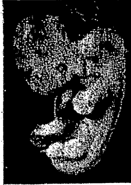
အမိဝမ်းတွင်း၌ ၅-ပတ်မှ ၆-ပတ် အတွင်း (ရက် အားဖြင့် ၄၀ ရက်မြောက် ) တည် ရှိ သော သန္ဓေသား။