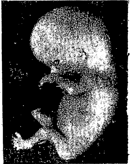
အမိဝမ်းတွင်း၌ ၇-ပတ်မှ ၉-ပတ်အတွင်း (ရက်အားဖြင့် ၆၀-ရက်မြောက်)သန္ဓေသား

ဤပုံကလေးများကို(Alan Brews)ရေးသားသော(Eden and Holland Manual of Obsfetricks) စာအုပ် (ဒသမနှိပ်ခြင်း)မှ ကူးယူဖော်ပြသည်။